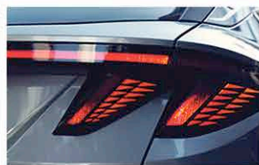
Combinaison Arrière LED Feux Arrières

CONSEILLERS DE VENTE - ERIC "RICO" TASSO: 0690 88 52 49 | DIDIER ABENAQUI: 0690 22 29 97