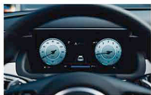
10.25 Pouces Cluster Numérique Ouvert