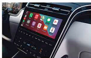
Écran Tactile 10,25 Pouces Avec Façade Centrale Entièrement Tactile